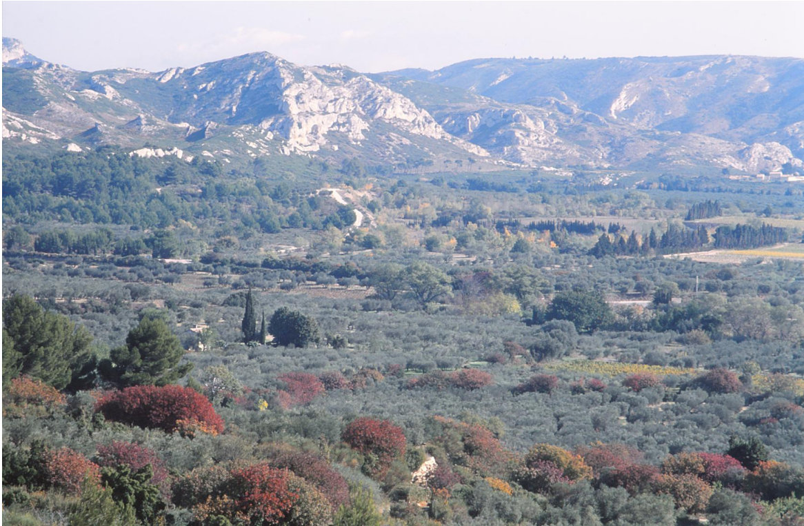
Les Baux de Provence

De KNNV heeft eerder excursies/natuurreizen georganiseerd naar afzonderlijke gebieden als de Luberon en de Camargue, maar deze reis beslaat nog veel meer gebieden.