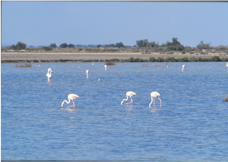
Flamingo's in de Camargue