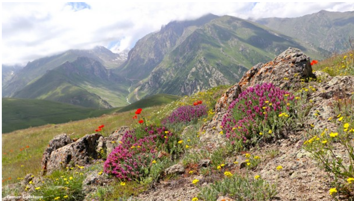
Bloemenpracht in Armenië

Deze bijzondere reis is een samenwerkingsproject tussen Kaukasus Plus Reizen en de KNNV en is speciaal bedoeld voor iedereen die een liefhebber is van bloemen en cultuur. Want je gaat onder zeer deskundige en bevlogen leiding op pad om veel van de flora van dit bijzondere land te zoeken op de mooiste plekken.