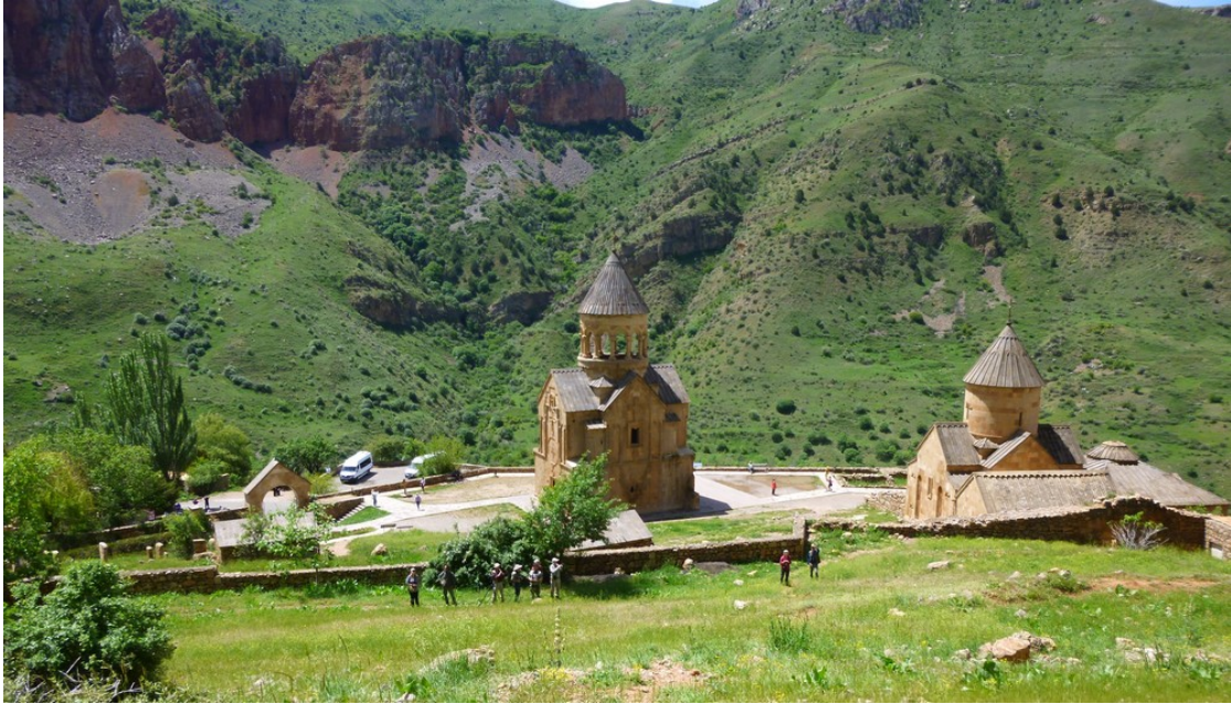
Het Noravank klooster

De reisduur is 15 dagen (28 april t/m 12 mei 2025). We verblijven in goed verzorgde hotels en privé-pensions. Er is gedurende de gehele reis een comfortabele bus aanwezig en op een paar plaatsen gebruiken we 4-wheel jeeps, allen met ervaren chauffeurs. Deze reis wordt begeleid door een KNNV-gids in combinatie met Tamara Galstyan, een ervaren Armeense floradeskundige (Engelsprekend). Zij fungeert tevens als cultuurgids.