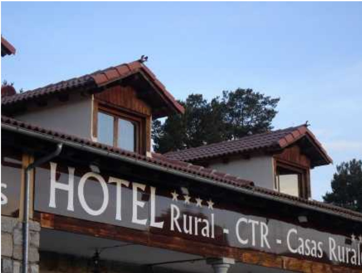
Zwarte Roodstaart op dak hotel rural Altogredos