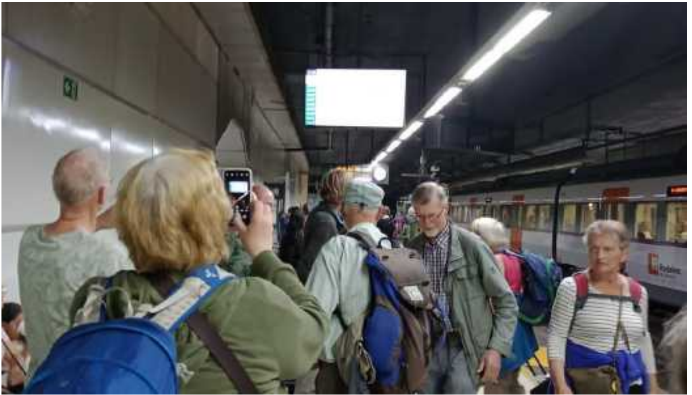
Op deze foto werd de treinvertraging vastgelegd – terwijl nog onbekend was wat de gevolgen zouden zijn...