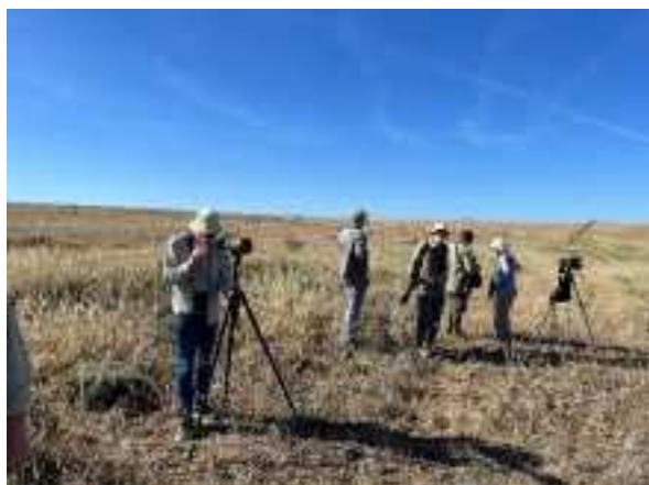
Vogelaars in de steppen

stemming voor een mooie baltpartij, maar een beetje balts-achtig gedrag werd toch gemeld. De Grote Trap, de zwaarste vliegende vogel, kwam zelfs op korte afstand voorbijvliegen.