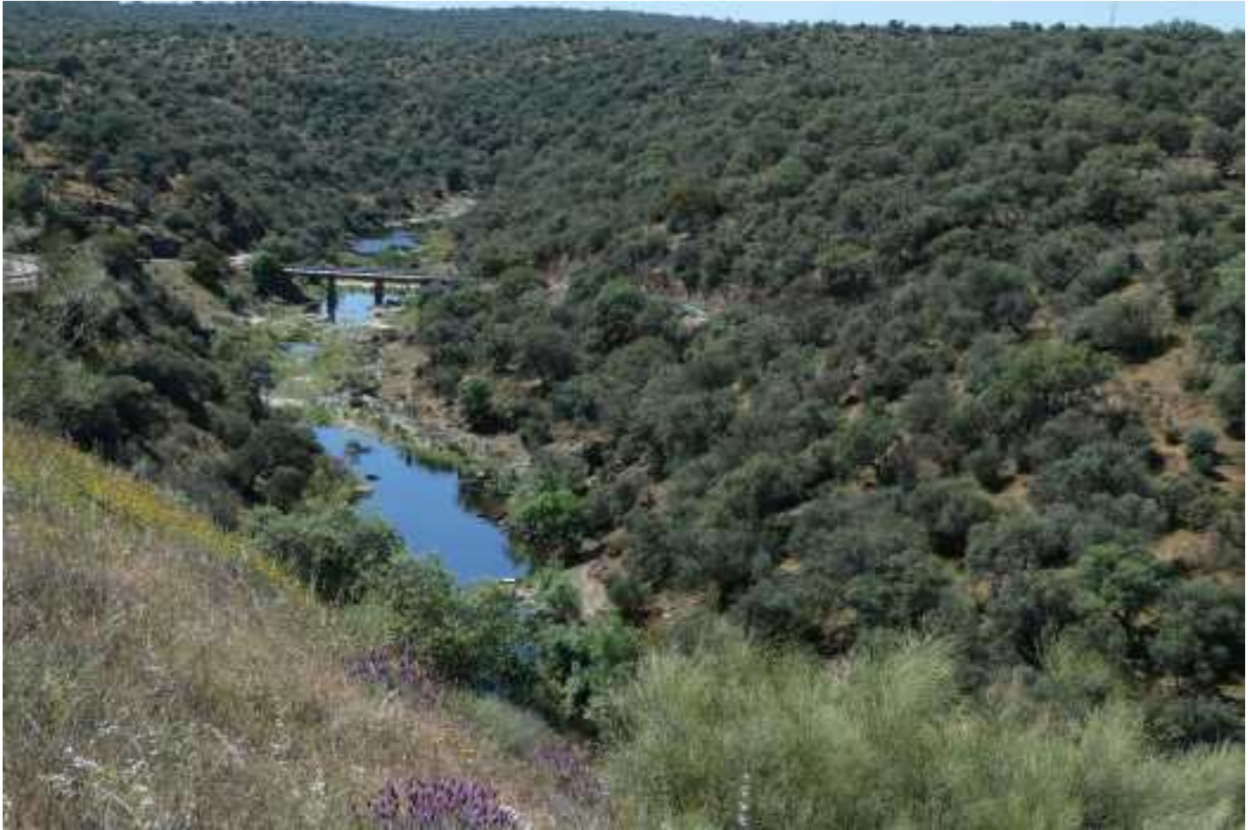
Het dal van de Taag bevat nog water maar stroomt niet meer door vele maanden droogte

Het wordt vandaag wéér een paar graden warmer. Er is besloten de tweede dag in de steppe dichterbij te blijven dan gepland, zodat we beter gebruik maken van de koelte in de ochtend. Er is daar ook iets meer water wat de kans op vogels vergroot. Dit is het derde jaar op rij met grote droogte in deze regio ; nu is het al vanaf januari droog.