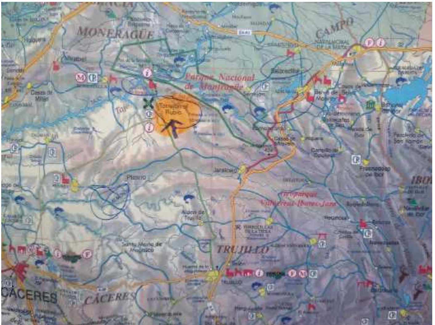
Kaartje omgeving Torrejón el Rubio (Extremadura, Spanje)

Extremadura , een regio in Midden-Spanje is één van de populairste vogelgebieden in Europa. Het is een glooiend heuvellandschap met kruidenrijke steppen, enorme bossen met steen- en kurkeiken, de zgn. Dehesas, bergketens en rivieren. In Extremadura komen vogelsoorten voor die elders in Europa moeilijk te vinden zijn, waaronder veel roofvogels, zoals Grijs Wouw, Monniksgier, Spaanse Keizerarend, Havikarend, Rode en Zwarte Wouw, Slangenarend en Dwergarend. Ook vele bijzondere soorten zang- en steppevogels broeden in Extremadura of komen er in grote getale om te overwinteren. Soorten als Roodkopklauwier, Zuidelijke Klapekster, Blauwe Ekster, Roodstuitwaluw, Blauwe Rotslijster, Griel, Trap, Kraanvogel en Grijs Gors zijn op veel plekken te zien. In de meegeleverde Crossbillguide 'Extremadura' staat een uitgebreide beschrijving van landschapstypen, habitats en de meest kenmerkende soortgroepen.