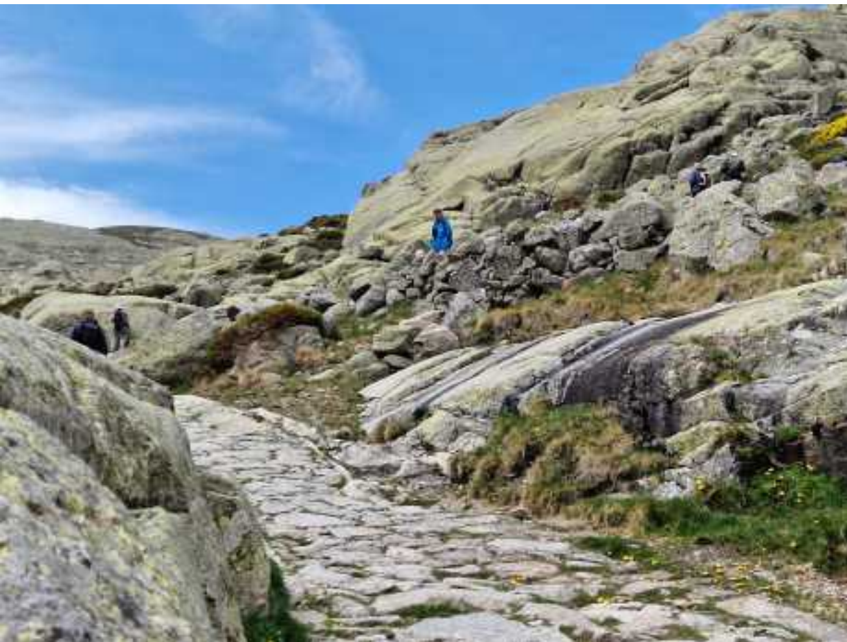
Sierra de Gredos