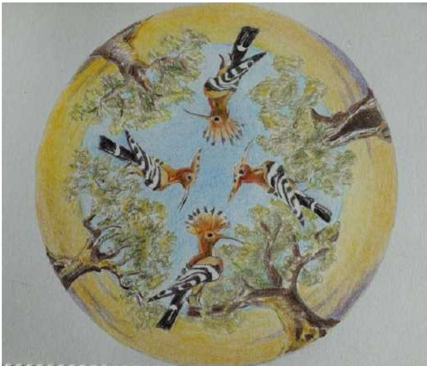
Hoppen © Tekening Elly van Es