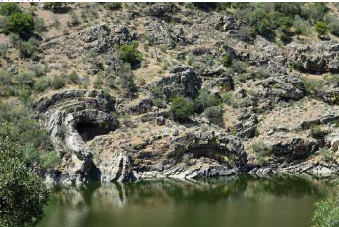
Portillo del Tietar