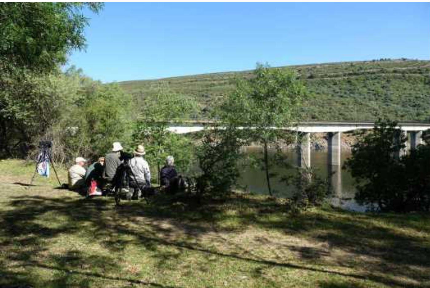
Brug over Taag