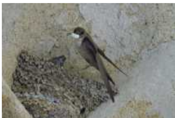
Rotszwaluw op kerk in Trujillo.

De eerste velddag maakte een grote indruk. Meer dan 60 verschillende soorten gezien.