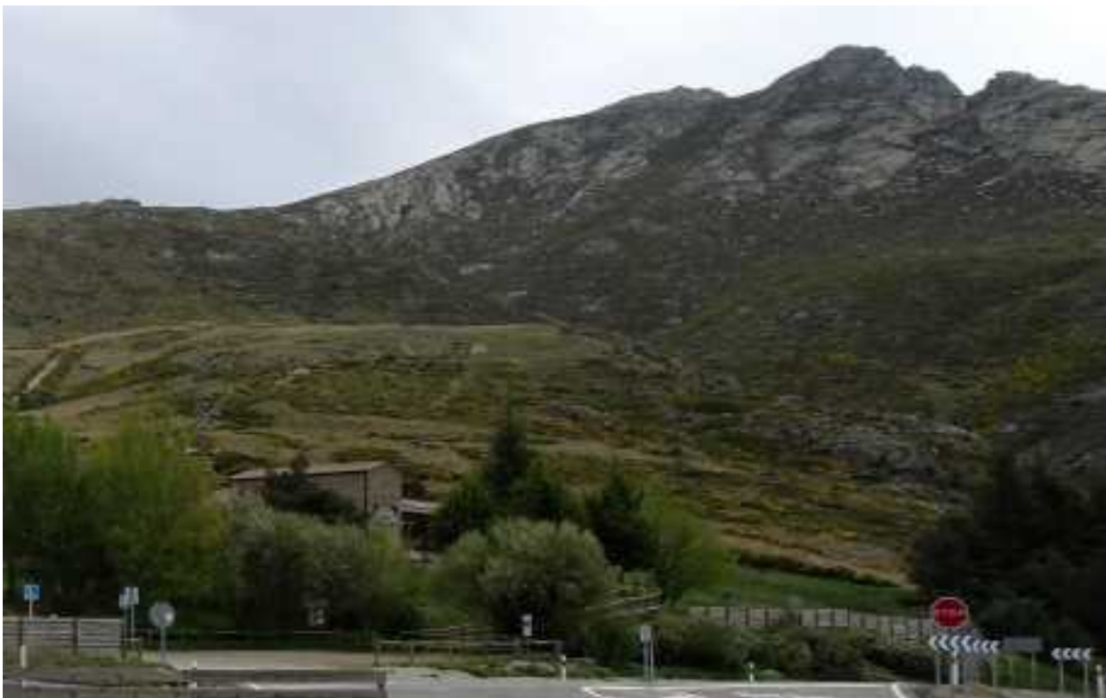
Mirador del Puerto del Pico