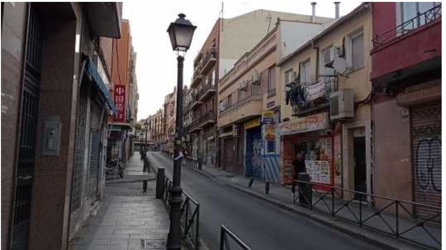
Straatbeelden Madrid achter Ibis Hotel