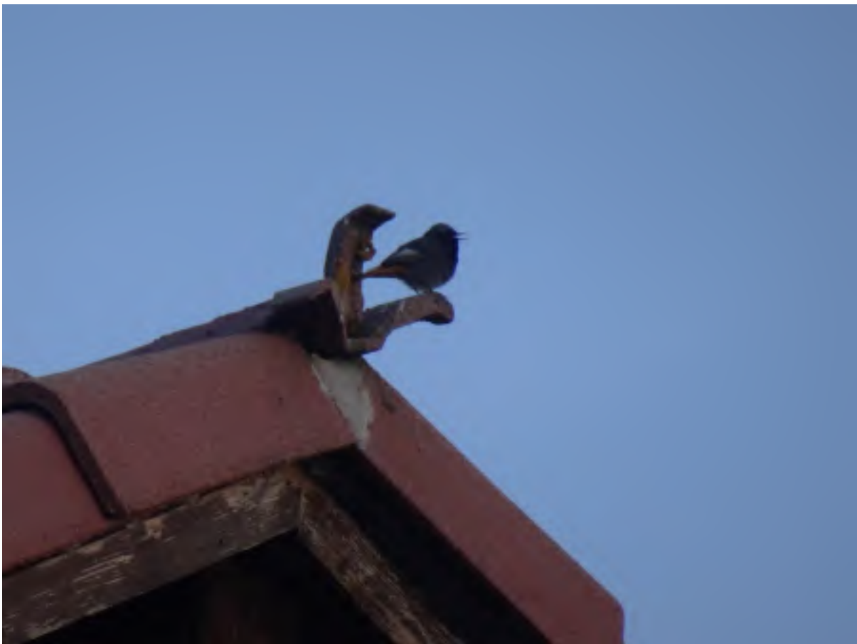
Zwarte Roodstaart op dak hotel rural Altogredos