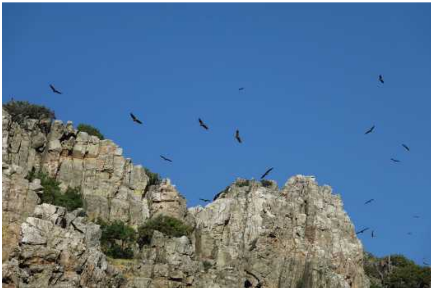
Vale Gieren stijgen op

We starten lekker vroeg, 8.00 op de klok.