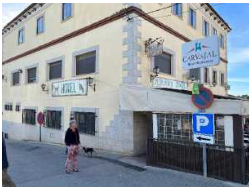
Hotel in Torrejon el Rubio

Omdat de verwachting is dat het weer vandaag en de rest van de week extreem warm zal zijn, is besloten tot een tropenrooster. Om het dagprogramma te beginnen met ontbijt om 7 uur en veldbezoek vanaf 8 uur. Dat betekent dat het nog donker is als we voor het ontbijt door het nog slapende stadje Torrejon el Rubio lopen. Daarom zijn de eerste waarnemingen in het dorp het uitbundige gezang van de zanglijster en het zoeven van de rondvliegende Huiszwaluwen.