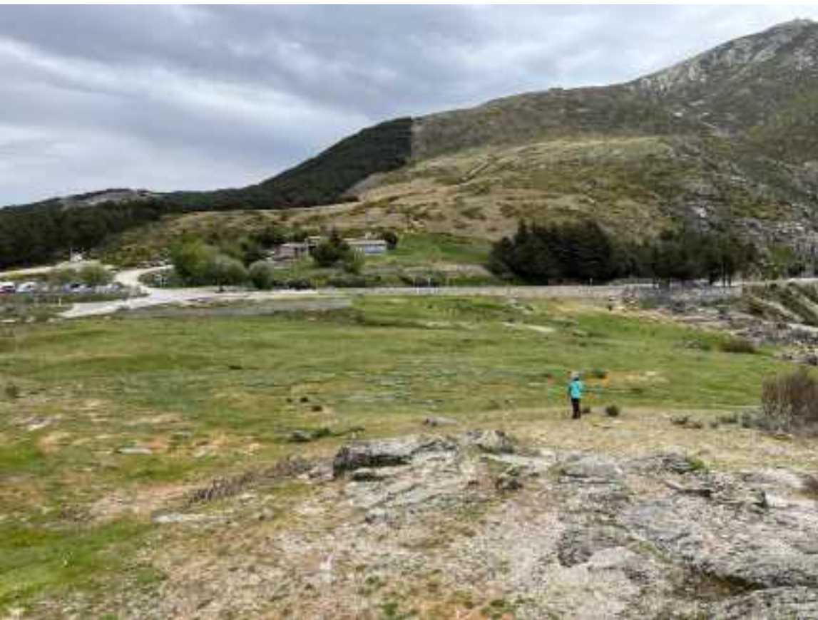
Sierra de Gredos