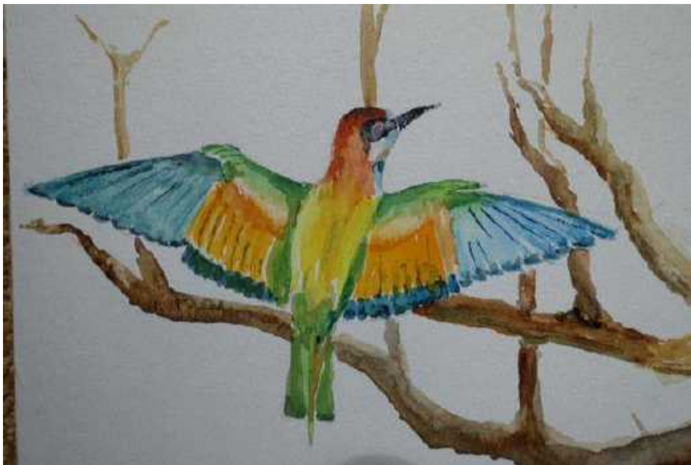
Bijeneter © Tekening Elly van Es

Rond half 4 vervolgen we onze reis en verlaten de Extremadura. De weg door het dal geeft af en toe ruimte voor vergezichten en dan zien we op enkele plekken ver in de hoogte sneeuw liggen. Van veraf zien we al het kasteel van El Barco de Avila. Over de brug rechtsaf parkeren we en kunnen naar de rivier de Tormes lopen. De oeverzone is rijk begroeid. Tussen de bomen staat onder andere Look- zonder- look en een grootbladige Vergeet-me-niet. Bij het water zit een Grote Gele Kwikstaart en er vliegt een Geel Oranjetipje. Frans ontdekt een Smalle Weegbree met afwijkende bloeiwijze. Na half 5 verlaten we dit centrum van de bonenteelt en zijn 3 kwartier later bij ons hotel, even buiten Hoyos del Espino. De hotelmevrouw spreekt helaas geen Engels maar het lukt om de kamers te verdelen. Om 8 uur is er een diner en we krijgen dan zelfs de keus of we de volgende dag rijst of patat bij de vis wensen. Voor sommigen is er nog even gelegenheid om een rondje te lopen langs de bosrand. Dan is een Bosuil te horen. Daarna hoog tijd om plat te gaan na een dag vol nieuwe ervaringen en indrukken.