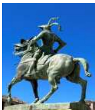
Standbeeld van conquistador Pizarro