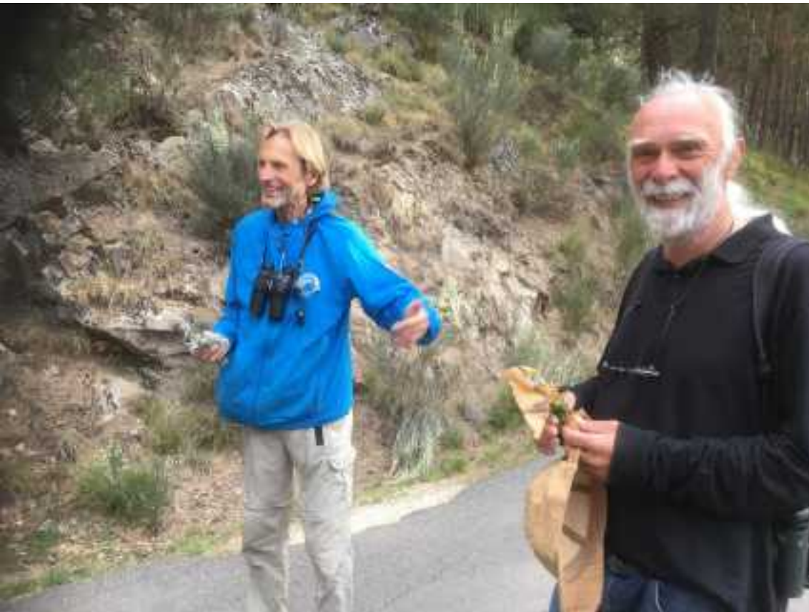
Foto-impresies van de reis en de excursies