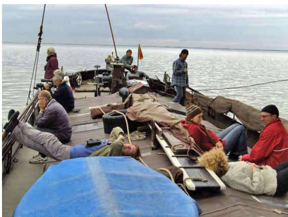
Alle hens aan dek