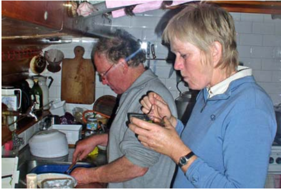
Kokkie en koksmaat