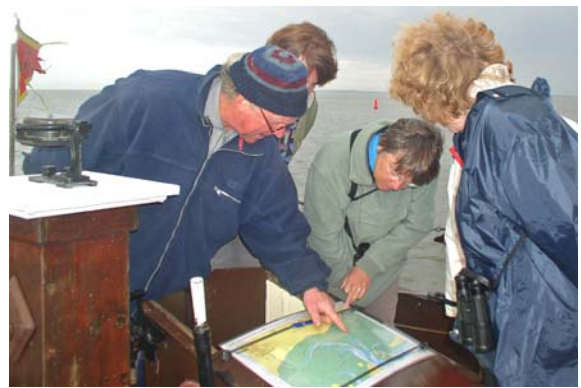
Waar wordt nu geschoten?

De Bruinvisch start korte tijd met schietoefeningen, waarbij vuurpijlen uit de pijp van de motor komen. Het is dan ook een motor met emotie, bouwjaar 1917. We gaan op de motor richting Schier; het water is blak. Ik mag even het roer nemen, omdat Cees moet helpen bij "gezeik met de wc". Gelukkig wordt het euvel verholpen.