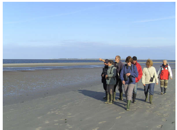
.....en er op uit

Er is een zeesterretje gevangen, dat bijna met het afwaswater werd weggegooid. Ook een gestippelde dieseltreinworm is door de wadlopers meegenomen. Wat ze al niet voor namen verzinnen voor die arme dieren.