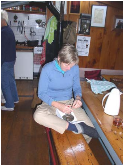
Tompoucen in de maak