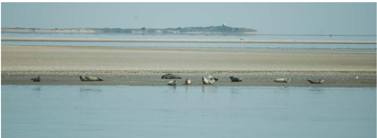
Zeehonden op Simonszand

We gaan een stukje langs militair oefenterrein, maar worden niet beschoten. "Misschien is het nu pauze." "Misschien schieten ze alleen in de pauze." We passeren een zandplaat (Simonszand) met een geweldige hoeveelheid zeehonden er op, nu ook gewone, groot en klein.