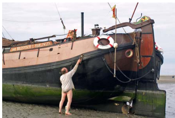
Nog gauw een likje verf