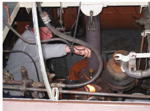
Cees is erg close met zijn motor

We zeilen richting Rottum- Rottumer plaat, met de kluiver erbij gezet, maar de wind valt vrijwel weg. Het laatste plan: via Simonszand en de Eilander Balg naar Schier.