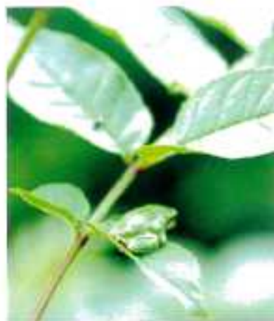
Flora en faune boerenzwaluw boomkikker