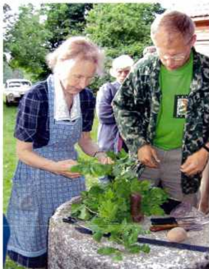
Artis met zijn moeder