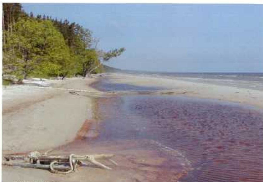
kust bij Siltene