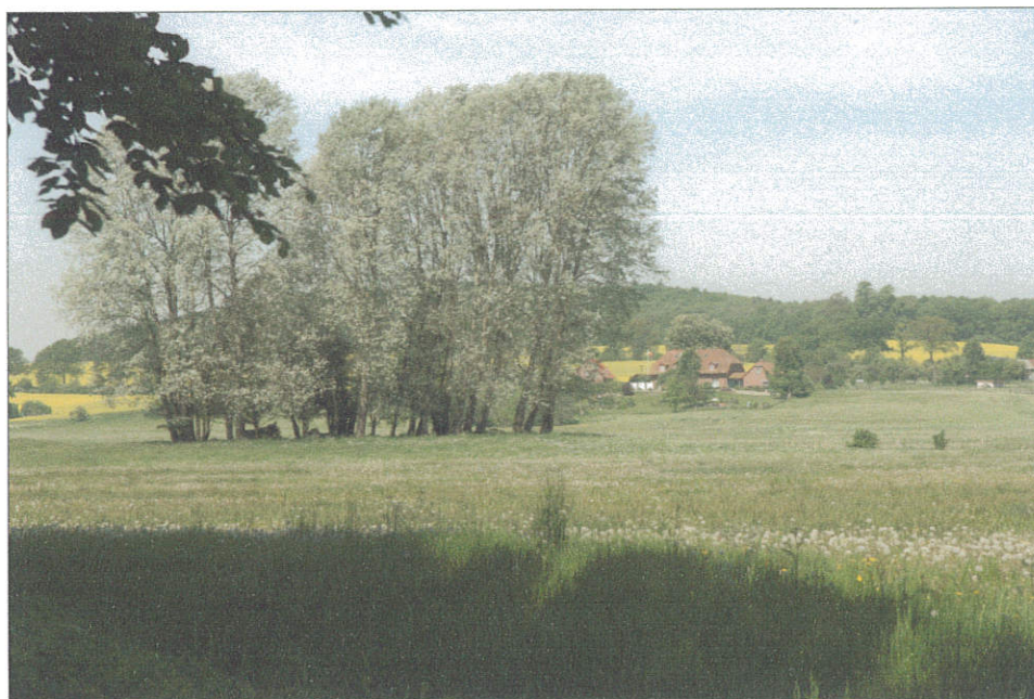
Bij de Torgelower See