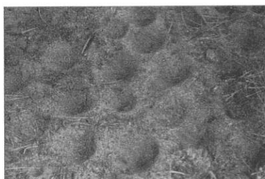
Mierenleeuw met schuilplaatsen