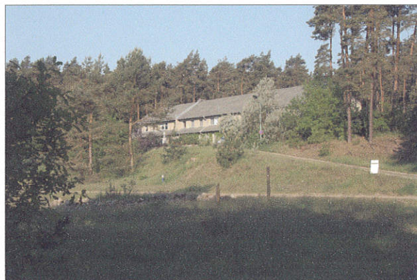
Pension Zur Fledermaus

ten gehore brengen. De melodie is zo eenvoudig dat het voor de overigen niet moeilijk is om het refrein mee te zingen. En met nog een laatste wijntje en biertje wordt vervolgens de dag afgesloten. Als laatste roept de Roerdomp ons in het donker een "wel te rusten". Wat zullen we weer slapen!