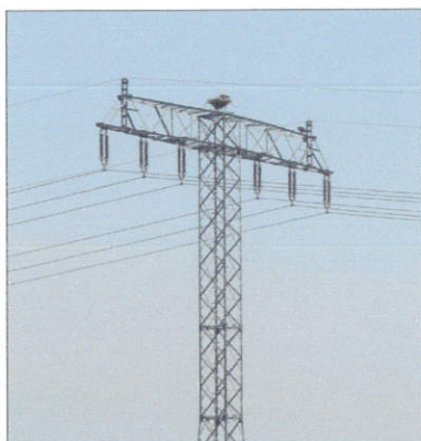
Visarenden, favoriete nestplaats