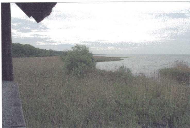
Observatiehut aan de Müritz