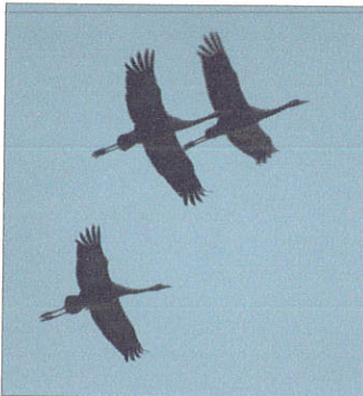
Afscheid van de Kraanvogels