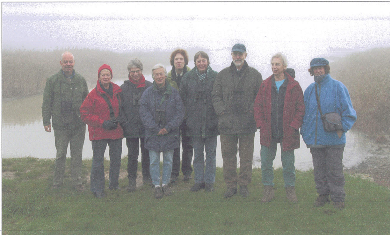
bij Belval, Argonne