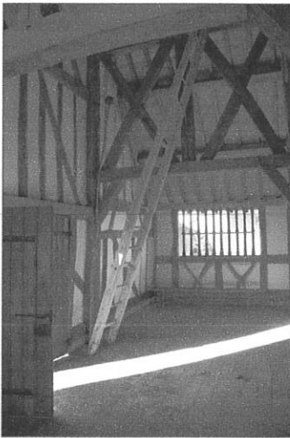
Vakwerkkerkje in Châtillon sur Broué

Al snel hebben we zicht op het noordelijke meertje (E. des Landres), waar tientallen dodaarsjes zwemmen samen met veel wintertalingen, futen, een vijftal krakeenden, twee knobbelzwanen en enkele kuifeenden. Langs een smal bospaadje bereiken we vervolgens het middelste meertje (E. du Grand Coulon). Onderweg gaan we over een ondiep beekje boordevol visjes. Geen wonder dat er ijsvogels worden gehoord (op de terugweg worden er daar minstens twee gezien). We bereiken een kleine vogelhut en zien - met tegenlicht - veel wintertalingen, dodaarsjes, futen en een aantal pijlstaarten. Buiten is de matkop te zien en te horen. In het vochtige grasland vindt Greetje een levende, maar wel erg trage moerassprinkhaan, wat een uitzonderlijk late waarneming is van deze -in Nederland vrij zeldzame - soort.