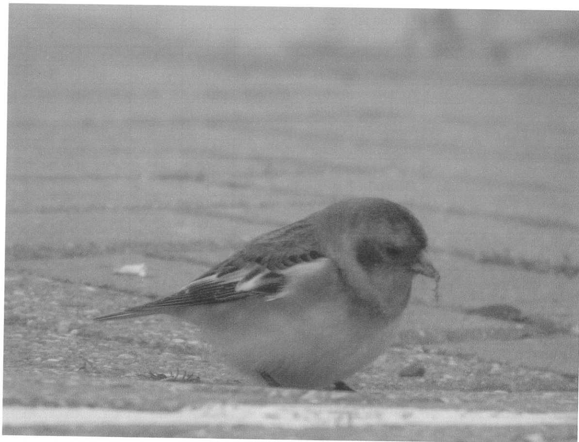
Sneeuwgorst in 1 e winterkleed