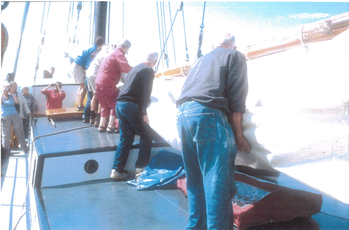
Het is soms hard werken aan boord van de Aagtje