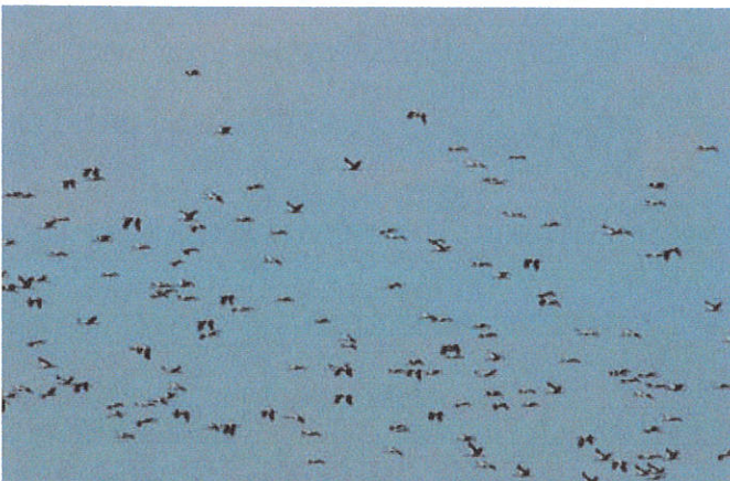
Ooievaars cirkelen omhoog op de thermiek

De terugrit onderbreken we op een terras, op een naburige grashelling met Eikenbomen hopen we Rouwmezen en Kleine vliegenvangers te zien. Het lukt anderen wel om de Rouwmees te zien, mij lukt dat (nu nog) niet, wel zie ik een Draaihals en een Syrische Bonte Specht. we