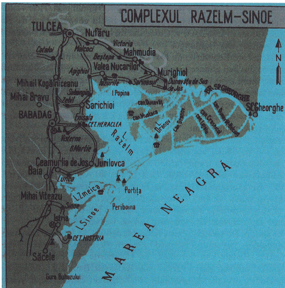
Een Roemeense kaart van een deel van de Donaudelta dat wij bezocht hebben