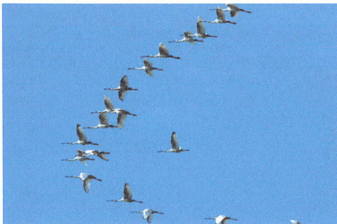
Lepelaars in V-formatie