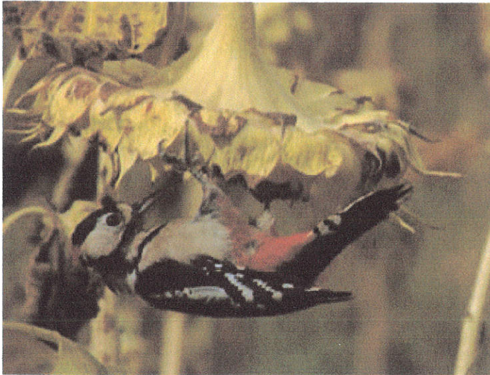
een Grote bonte specht aan de maaltijd

Bij een winderig meertje met een uitgedroogd moerasrietland worden we losgelaten op een aardappelveldje, voor een koffiepauze. Een eenzame Kwak stijgt op uit het riet en terwijl ik zit te schrijven passeert mij een groep van zo'n 150 Pelikanen stilzwijgend in dubbele V formatie boven het water. Bij een spoorwegovergang gekomen worden de bomen voor ons dichtgemaakt. We wachten zes minuten, maar dan komt er inderdaad een trein. We kunnen weer. Langs de weg staan veel walnootbomen. We zien veel dat de noten er met stokken worden uitgeslagen. We wandelen aanvankelijk over de verharde weg door het Babadagbos, totdat het busje ons weer komt halen, waarna we langs de rand van het Babadagbos met aangrenzende zonnebloemvelden wandelen. Bijzonder, we vinden Bonte Spechten hangend in de zonnebloemen, ook Glanskopmezen, en boven het