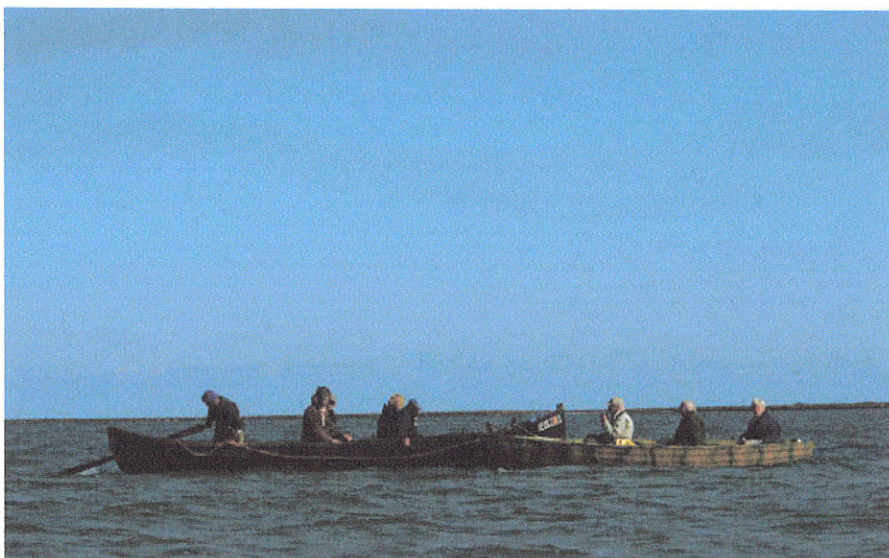
KNNV-leden op het Razimmeer