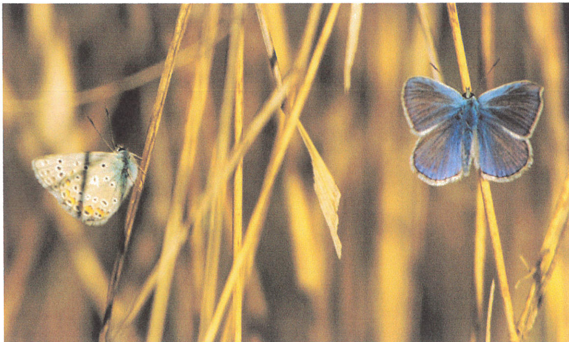
twee blauwtjes uit de delta