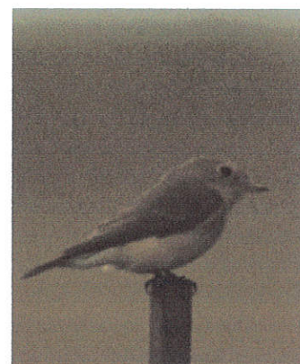
wie van de drie?

Op naar (H)istria: een Griekse stad uit 700 voor Christus. Eerst een enkele regenbui, daarna buiige regen. Ben had vast niet goed geslapen. En het programma viel ook nog in het water. In Histria een door de EU betaald museum met vondsten uit de Griekse tijd en een terrein met opgegraven ruïnes bezocht. De opgravingen uitgebreid bekeken (veel te lang volgens Ben), maar volgens iedereen zeer de moeite waard. Het was trouwens ook een mooi vogelgebied. Op een paar meter hek zit een Grauwe vliegenvanger, een Bonte vliegenvanger en een Kleine vliegenvanger, maar ja die wind en al dat vocht. Trudy sloot er vriendschap met alle plaatselijke straathonden. We eten onze lunchpakketten op in een soort cafetaria, wij zijn er de enige bezoekers. Hierna verder naar een ex-chemische fabriek, een mooi staaltje van verval. Onderweg een steppenkiekendief. Het regent nog steeds. Op een plasje veel Dwergmeeuwen en aan de overkant een Vorkstaartplevier (toch nog!) maar dat weer. Door alle oponthoud de gorges, waar we