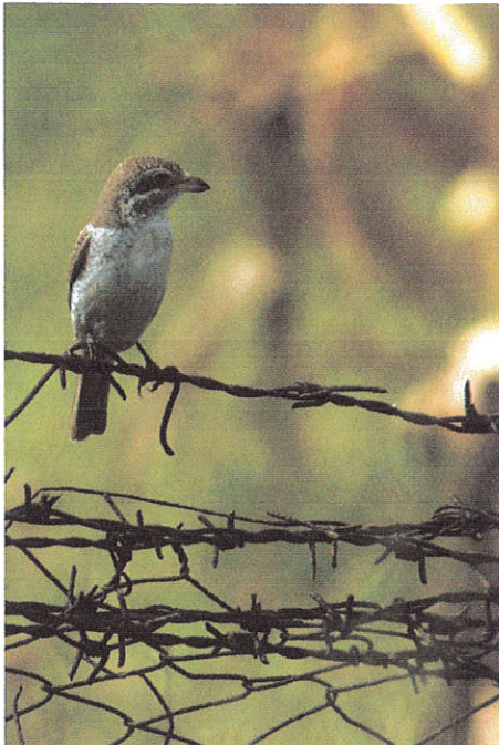
Jonge Grauwe klauwier

De tocht begint meteen al goed met een fraaie Arendbuizerd in het veld vlak langs de weg even buiten Plopu. Niet veel kilometers verder ontdekt een duffe vogelaar vanuit de rijdende bus een volwassen Roze Spreeuw op een betonnen muurtje rond een varkensmestrij. Stoppen! Wanneer iedereen is uitgestapt en Jop en Ernst zo vriendelijk zijn geweest hun telescoop uit te pakken blijken er iets verder op het muurtje ook nog een pluizige jonge Steenuil en een Grauwe Klauwier te zitten. Een Hop fladdert voorbij en wat roofvogels zeilen over, waaronder zowaar ook een donkere fase Dwergarend, de enige van de hele reis. Als even later ook László arriveert in zijn eigen auto, is hij blij verrast met de ontdekking van deze Roze Spreeuw want het blijkt de laatste waarneming ooit te zijn in Roemenië. Deze fascinerende soort heeft vanuit winterkwartier India westwaarts een invasieachtig broedvoorkomen dat reikt tot Oost-Europa en dat bepaald wordt door de beschikbaarheid van nestgelegenheid – holtes tussen rotsblokken; vaak meerdere nesten in één holte – en van voedsel in de vorm van krekels; aantallen broedparen en lokaties van broeden verschillen dus sterk per jaar. László vertelt ons verder nog dat in Roemenië – niet toevallig wellicht met het oog op deze zeer late waarneming – juist dit jaar de grootste broedinvasie van Roze Spreeuwen ooit heeft plaatsgevonden. Van deze geschatte 60.000 broedparen op drie verschillende lokaties zal hij ons later op deze reis overigens