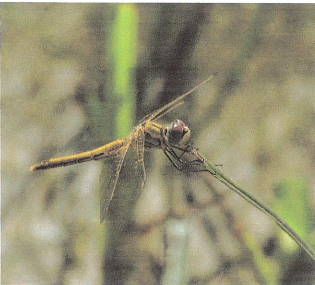
Steenrode heidelibbel (♀)

Bij de splitsing van twee kanalen drinken we om 11 uur koffie. Aan de linkerkant zien we een vogelkijktoren.