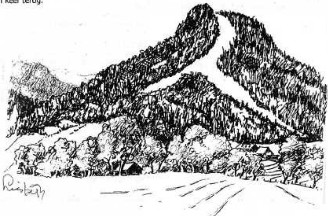
Tekening: Liesbeth de Kl.

Daarna wandelden we naar ons hotel, waar we rond 13.30 uur aankwamen.