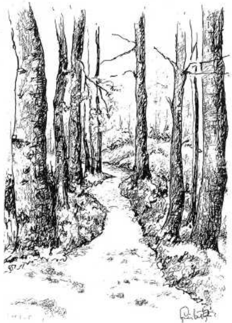
Tekening: Liesbeth de Kl.

Achter, voor en overal, met zevenmijlslaarzen. 't Korte broekje heeft voor Bruine benen gezorgd.