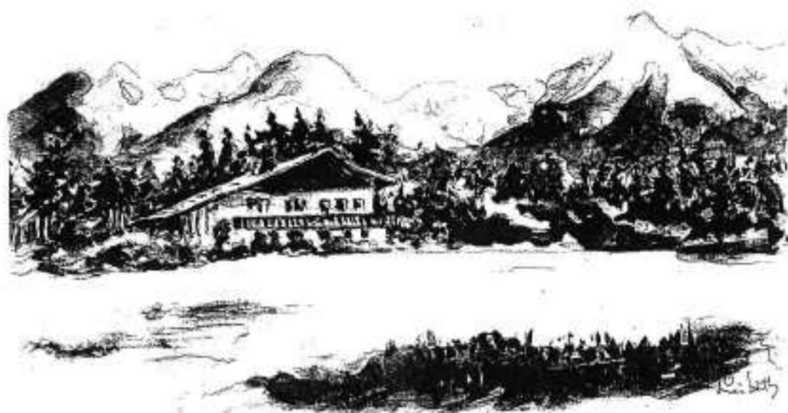
Tekening: Liesbeth de Kl.

Iedereen is zeer tevreden met zijn kamer met gezellig en zonnig uitzicht vóór of schitterend op de bergen en hooiweiden – maar koel – achter.