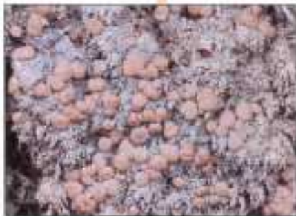
Baeomyces - Rode heikorst