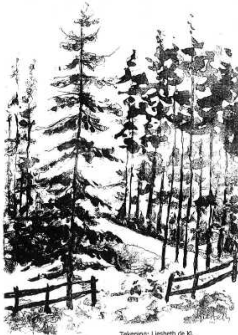
Tekering: Liesbeth de Kl.

Am Beginn der Sechzigerjahre begann man mit dem Bau der Dachsteinstrasse und 1969 fuhren die ersten Gäste mit der Dachstein-Südwandbahn in 8 Minuten hinauf zum Hunerkogel.