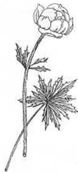
Trollius - Kogelbloem