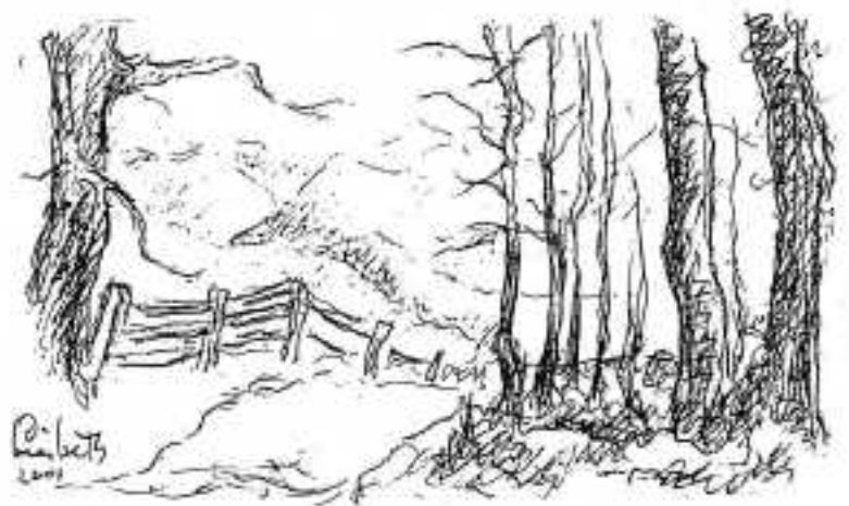
Tekening: Liesbeth de Kl.

Bij de bushalte wachtten we tevergeefs op de bus. Die rijdt alleen maar als er school is. Op deze vrijdag - na een feestdag - dus kennelijk niet. Dan toch maar een taxi bellen om thuis te komen, terwijl 7 sportievelingen helemaal naar Ort liepen.