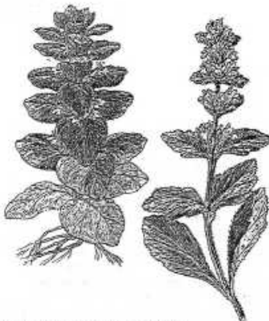
Piramidezenegroen en Helde zenegroen

De wolken hingen laag, er was geen berg te bekennen. Het regende en het was behoorlijk fris. Maar we lieten ons niet weerhouden en precies om 9.15 gingen we, gewapend tegen kou en regen, welgemoed op stap. We sloegen rechtsaf de verkeersweg op, richting Dachsteinstrasse. Na ongeveer een kilometer, even vóór Lärchenhof, gingen we linksaf naar boven, richting bos. Hier paktten we de Kulmbergrundwandeling weer op, maar nu in tegengestelde richting. De wandeling gaat grotendeels door naaldbos en de markering is overduidelijk. We moesten alle aandacht richten op de vele wortels die behoorlijk ver boven het pad uitstaken. Goede voetengymnastiek! De onderbegroeiing zag er door de regen fris en glanzend uit. Er waren veel varens: mannetjes-, wijfjes- of stekelvarens? We wisten het niet precies, maar mooi waren ze. Evenals de Cirsium heterophyllum , nog maar net met zijn grondbladeren boven de grond verschenen. Deze zijn, evenals de later verschijnende stengelbladen, aan de onderkant witviltig. Een duidelijk kenmerk van deze weinig stekelige distel.