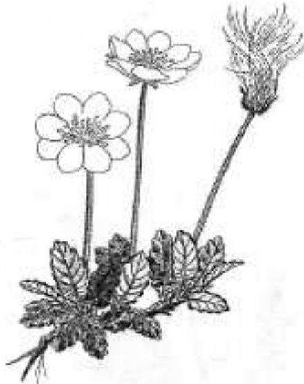
Achtbladige zilverwortel (Dyras)

We vertrokken om 9.05 met de bus vanaf Ramsau omhoog en stapten uit bij de halte Glötsalm op ± 1500 meter. An, Nels en Liesbeth Kl. gingen nog een halte verder om daar rond te kijken en later de bus terug naar Ramsau te nemen.