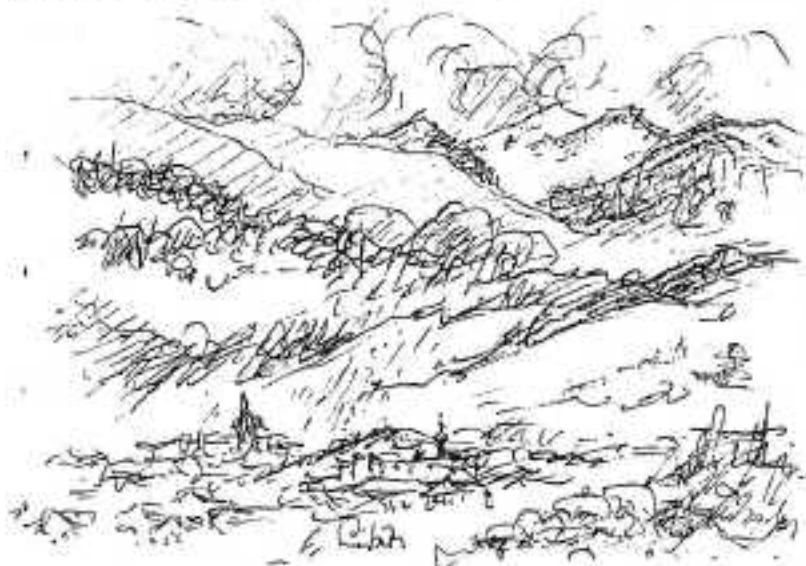
Tekening: Liesbeth de Kl.

Iedereen schatert het uit en tevreden dat ónze rugzak vast niet zo zwaar is gaan we even later weer op stap via Walcherhof en Clösehof tussen de bloeiende Lijsterbessen en witte schermbloemen richting Tolweg. Het pad langs de Schildlehenbach is één feest van planten en vogelgeluiden.