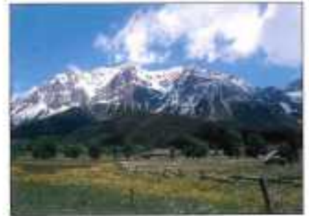
Besneeuwde bergen / bloemenweide