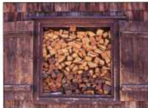
Schuur met hout