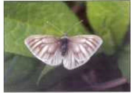
Berg geaderd witje