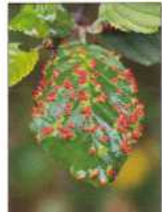
Haagbeukje met rode gallen