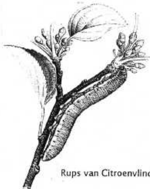
Rups van Citroenvlinder