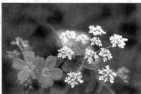
Bosooievaarsbek en Fluitekruid